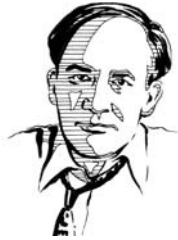
Рафаель Лемкін (1900–1959)

Відомий американський правознавець-міжнародник, правозахисник, автор визначення терміну «геноцид»