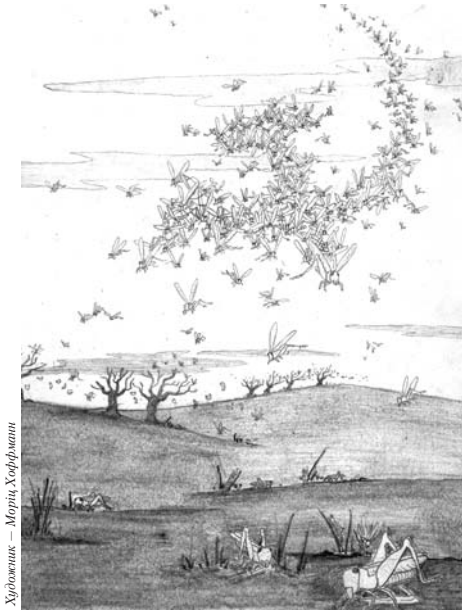
Художник — Моріс Хорфманні

Росії. Це справді необхідний крок у процесі «з'єднання», що, як дуже сподіваються советські вожді, створить «советську людину», «советську націю». Заради цієї мети, цієї об'єднаної нації кремлівські вожді радо знищать нації й культури, які здавна заселяли Східну Європу.