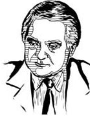
Богдан А. Футей

Суддя Федерального суду претензій США, професор Українського Вільного університету в Мюнхені